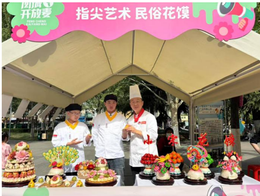
图 5-11 晋城中专“非遗花馍”走进南街社区宣传