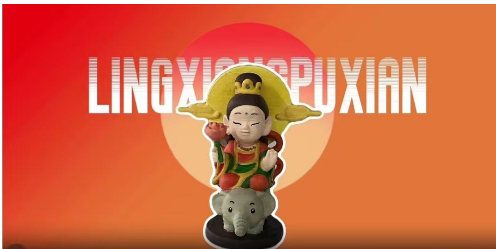
图 5-4 文明风采获奖作品《智慧普贤 3D AI 造像纪》

闫帆教师指导学生们用建模软件设计北宋菩萨造像，生成创意设计方案，3D 打印机制作出后由工匠师傅和专业教师指导手工上色。科技不仅缩短了传统工艺的学习周期，更让学生在“数字复刻”与“手工创作”的碰撞中，理解工匠精神“守正创新”的核心，该作品获文明风采大赛手工艺品一等奖。这种“科技赋能+师徒传承”的实训模式，让工匠精神从“老师傅的经验”变为“年轻人的创新实践”，真正实现了“以技育人、以新传匠”。