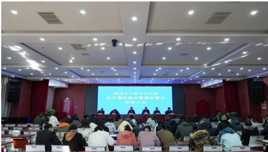
图 7-4 2025 年党风廉政建设暨廉政警示教育大会

干部深刻认识作风建设永远在路上。学校坚持严的主基调不动摇，常态化开展纪律教育和廉政警示教育，细化工作方案，组织全员自查自纠并签订承诺书。在五一、国庆、中秋等关键节点，校党委对党员干部进行廉洁提醒与排查，扎实开展年度抓基层党建和中层干部述职述廉评议，确保责任落实。同时，学校持续抓严廉政建设，深化纠治“四风”，通过开展“1+3”廉政警示教育月活动、强化节假日提醒、加强纪法教育和党性教育等方式筑牢思想防线，持续推进“清廉学校”建设，强化师德师风，定期组织清廉活动和廉洁教育培训，制作清风润晋微视频《师者如光》，积极营造清廉文化氛围。