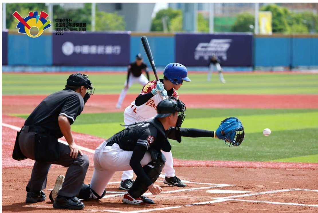
图 6-5 棒球比赛---击球手与捕手的巅峰较量

格、竞赛规则与裁判标准。通过构建理论与实操深度融合的教学模块，着力培养学生掌握国际化竞技技能与专业素养，显著提升了专业教学的先进性与学生的国际竞争力，有力推动了该专业向高标准、国际化方向特色发展。