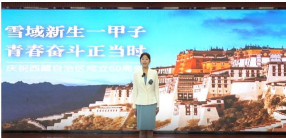
图 5-10 学生诵读作品

成立 60 周年》3 部作品参加文明风采比赛并获奖，有效实现了“以文化人、以声传情”的育人目标。