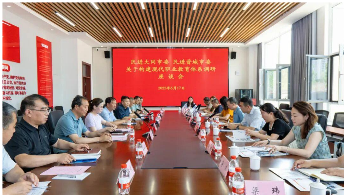
图 4-8 晋城-大同民主党派关于构建现代职业教育体系座谈会

校在党建引领、教学改革、产教融合、校园文化等方面的创新理念与实践成果，有效促进了市域及校际间的经验共享与理念互通，提升了学校的影响力。