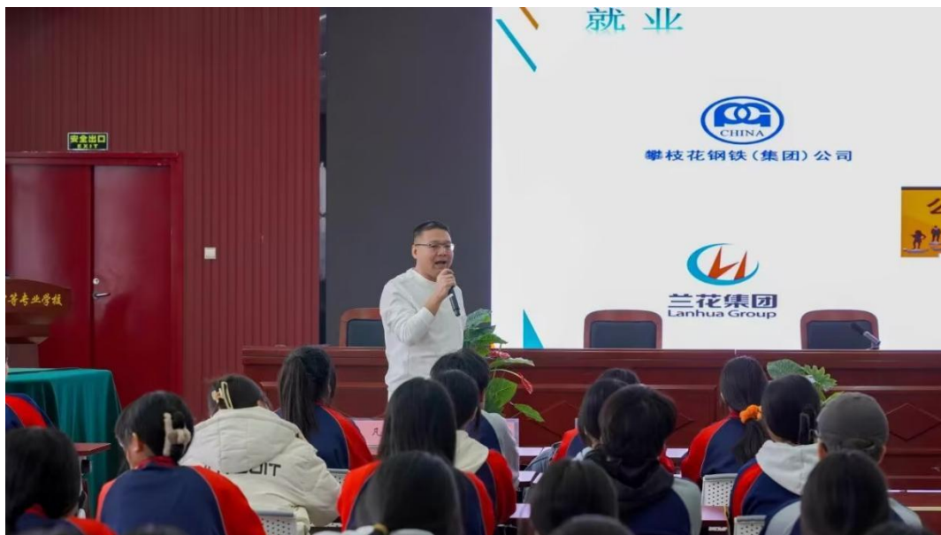
图 5-3 青年榜样故事宣讲会