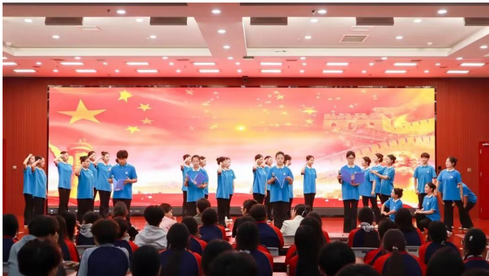
图 5-7 红色革命读书会