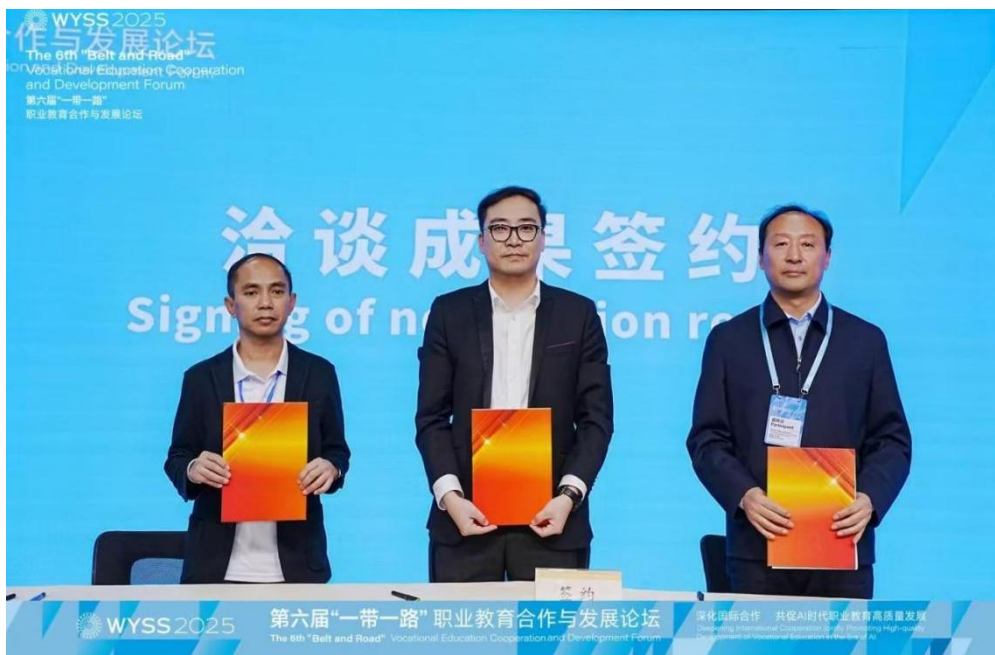
图 6-2 中学校与菲律宾高中签订合作协议

学校与菲律宾博尼法西奥堡高中正式签订产教融合“职教出海”合作项目，以“中菲合作，教学交流”为核心，开启两校教育资源共享、人才联合培养，实践基地共建等形式，推动双方在职业技能培训、产业需求对接等领域的协同发展。此次合作不仅为学校“职教出海”战略注入新动能，更搭建了中菲青年学子互学互鉴的桥梁。未来，双方将以项目为纽带，探索“产业需求导向+教育资源输出”的创新模式，助力两国职业教育高质量发展，为区域经济合作培养具有国际视野的应用型人才。