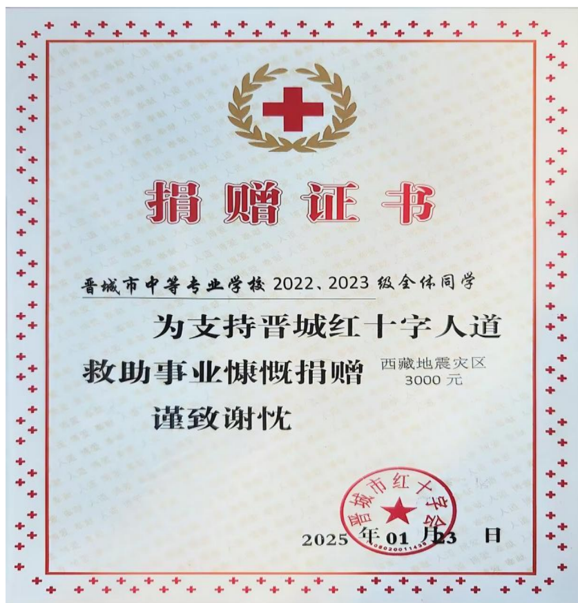
图 4-2 学校捐赠西藏地震灾区证书

教师层面，2025 年 4 月 20 日，“跟着悟空跑泽州”2025 泽州丹河新城半程马拉松比赛中，学校为运动员们提供中途补给；2025 年 5 月“摇滚编年史超级演唱会”在丹河新城丹河体育场开唱，学校派出学生教官辅助执行演唱会安保任务。王乐、宋海波、许丹阳 3 名教师走进汇仟小学、星河学校等 5 所中小学开展科普进校园活动。护理专业赵晨孜等 5 名教师与晋城市红十字会合作，在重阳节为全民健身主题活动提供救护服务工作。