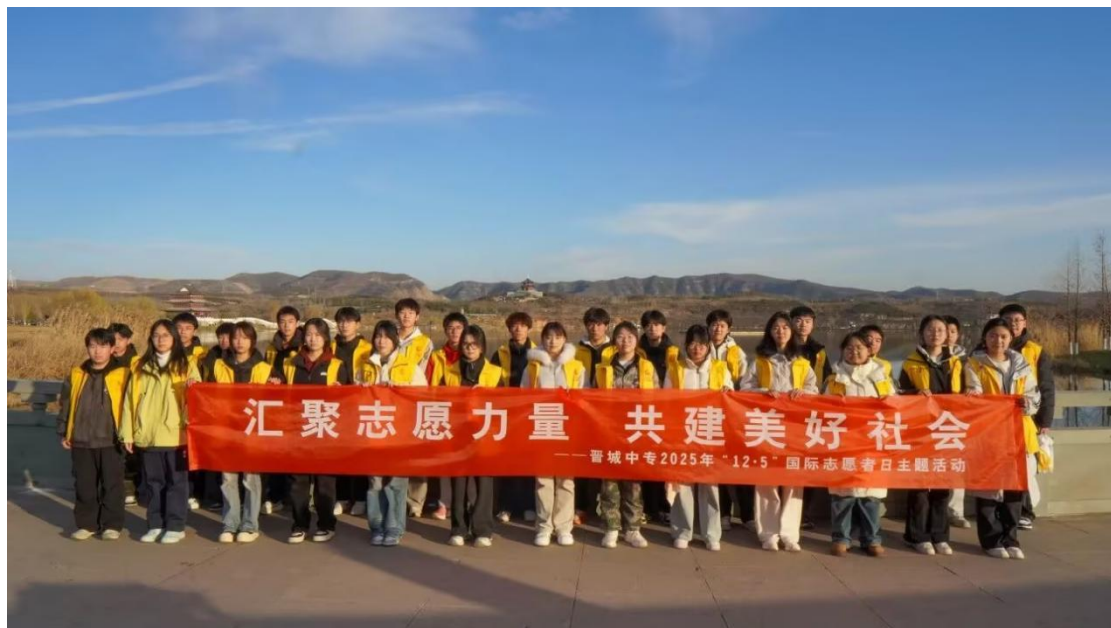
图 6-3 2025 年国际志愿者日主题活动