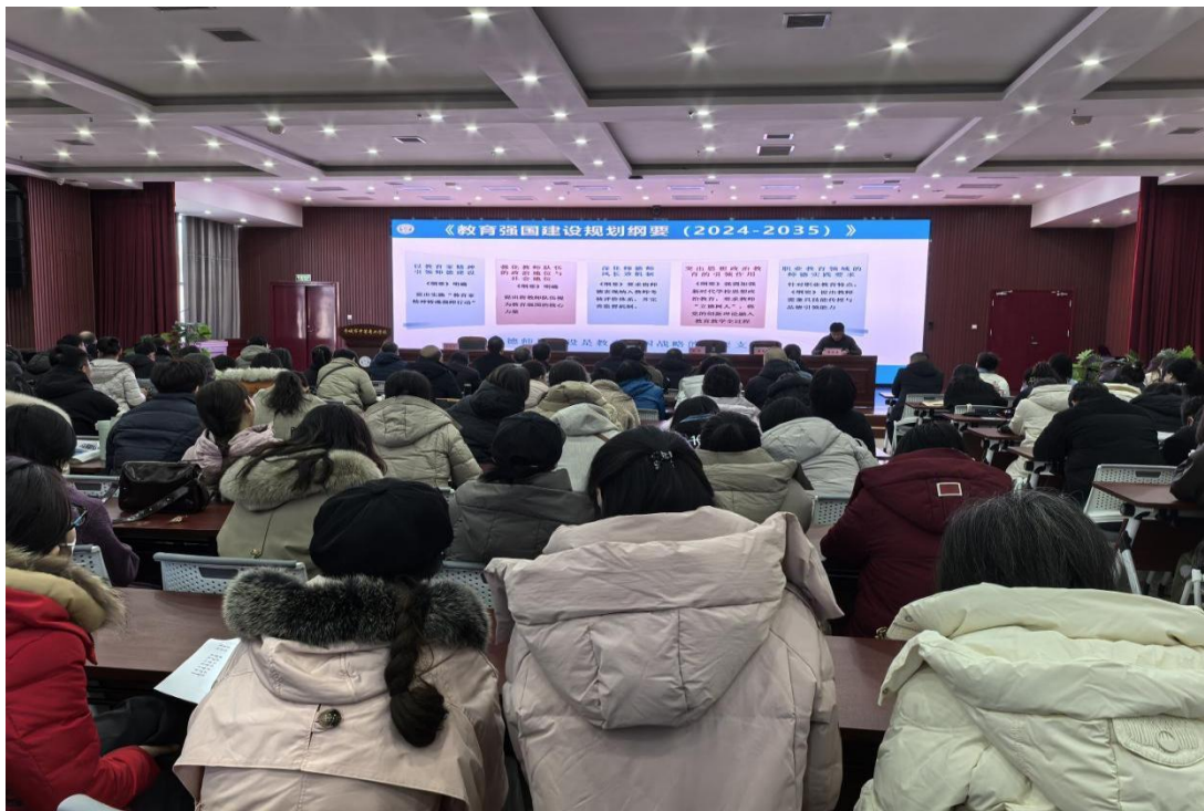
图 7-5 全校教师集体学习《教育强国建设纲要》

学校以三级联动机制构建政策落实闭环，2025 年 3 月邀请 3 位专家进校解读《教育强国建设纲要》核心要义，围绕“职业教育服务产业发展”“数字化转型赋能教育”等主题开展专题讲座，覆盖全校教职工，确保政策理解无偏差；学校党委和校委会牵头制定《落实〈教育强国建设纲要〉实施方案》，明确“专业升级、产教融合、师资建设”三大任务清单，将政策要求细化为 20 项具体指标，通过“周调度、月总结”机制压实责任；各系部通过教研活动传达政策核心要义，教师将政策要求转化为教学行动。汽车与智能工程系围绕“新能源汽车产业升级”调整课程体系，无人机专业结合“低空经济”政策开发实践课程，全校形成“专家引领—顶层设计—系部执行”的系统化推进格局。