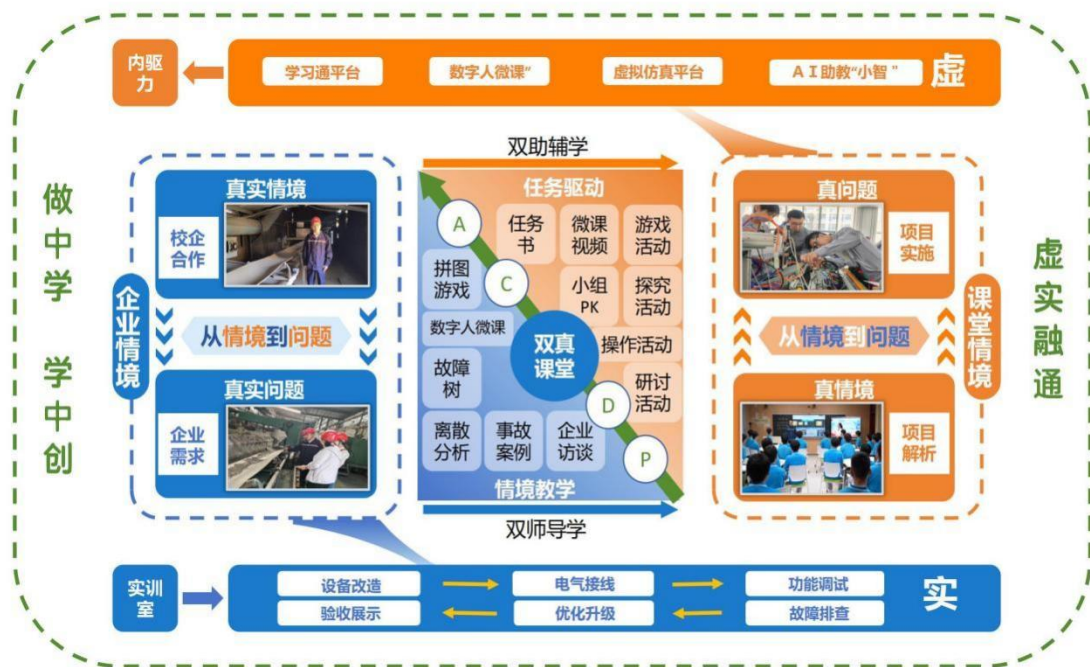
图 3-10 企业生产案例转化教学项目

向，共同搭建学生技能成长的闭环通道。双方依据国家《职业教育专业目录》和《职业教育专业教学标准》及企业岗位能力矩阵，设计了“认知实习→跟岗实习→岗位实习→预就业”的递进式技能成长路径，实现学生从理论学习到岗位实践的阶梯式进阶。企业派遣2名技术骨干与学校机电教师组成“双导师”团队，共同承担《自动化生产线安装与调试》《气动与液压传动》等核心课程教学，并将企业真实生产案例转化为20余个教学项目，让课堂内容与产业需求无缝对接。学生岗位适应周期平均缩短约40%。这一通道将企业用人标准前置到人才培养全过程，有效推动学生从“在校生成”到“准员工”再到“熟练技工”的无缝衔接。