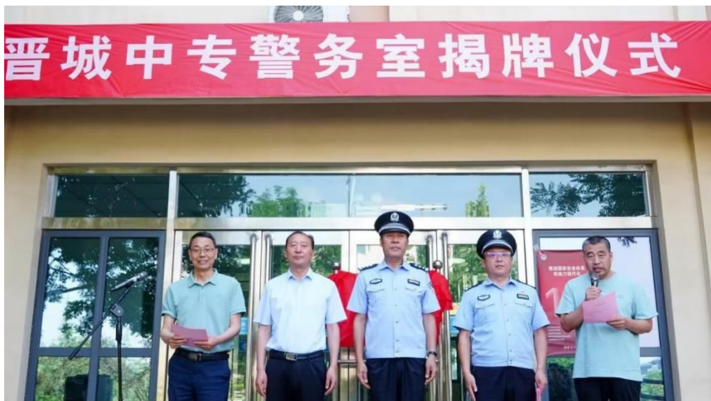
图 7-7 晋城中专警务室揭牌仪式

受到用人单位“职业素养好”的评价占比达 95%。通过系统化的德育管理，学校切实将政策要求转化为学生内在的道德品格与行为习惯，为培养德技并修的高素质技能人才奠定了坚实基础。