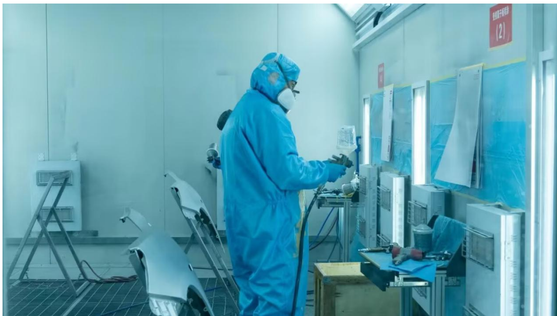
图 3-9 汽修专业学生在企业定岗实训---汽车喷涂