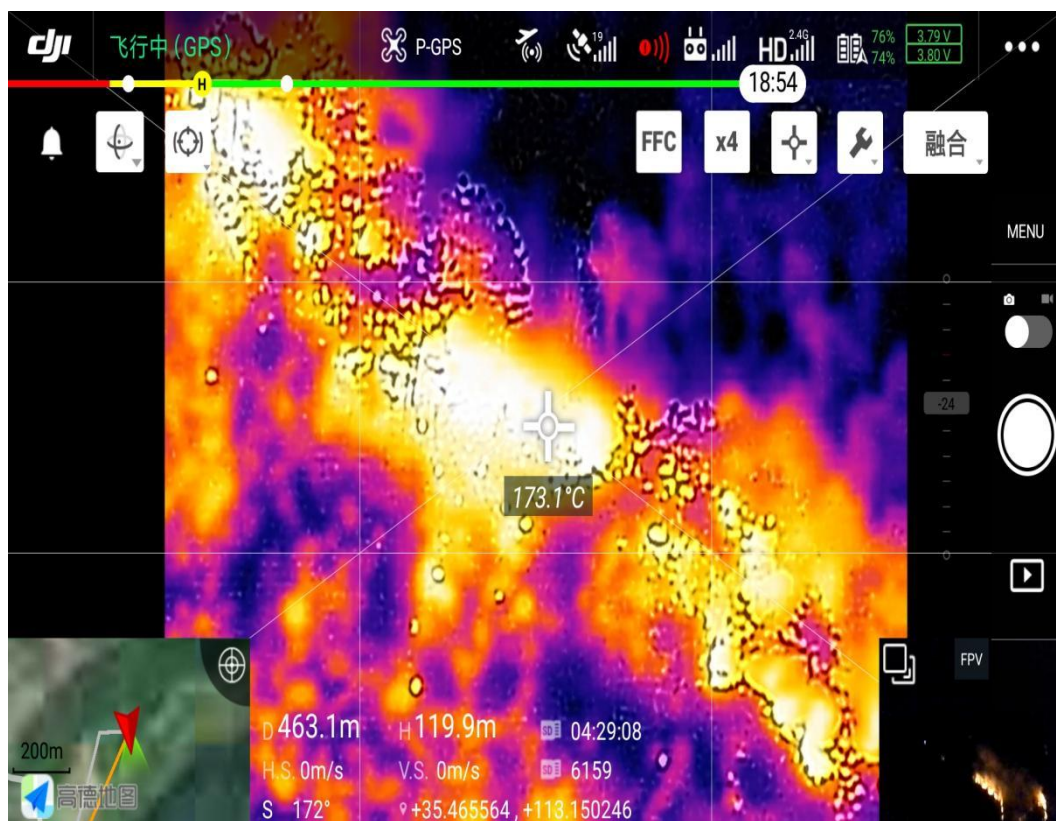
图 4-1 无人机助力火灾救援热成像