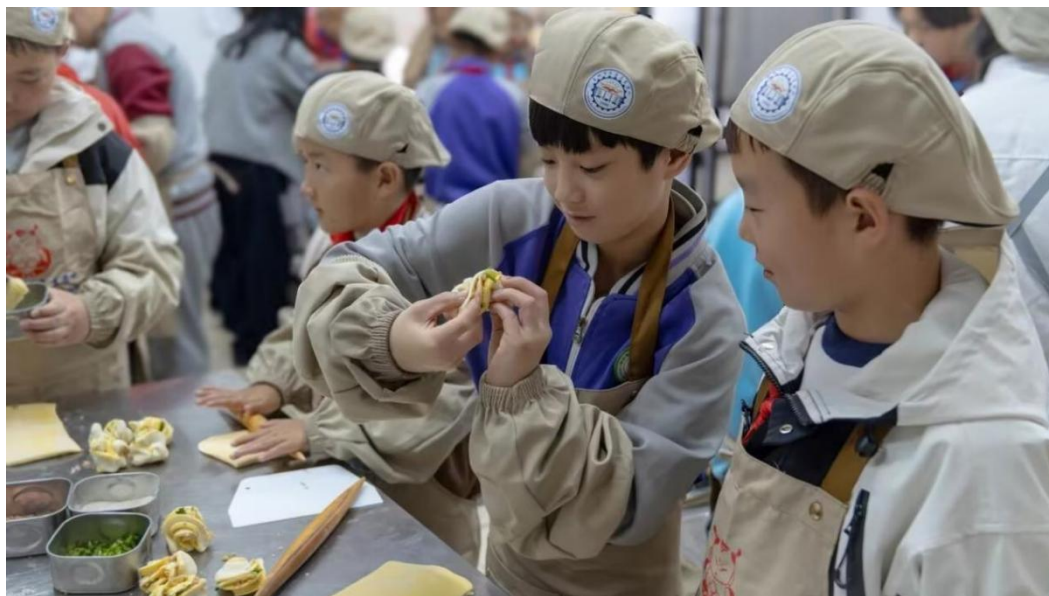
图 4-7 指尖上的美味:孩子们的面点初体验

色课程，设计开发趣味性高、参与度强的体验内容，使中小學生进一步了解中式面点师的职业技能与职业文化。汽车维修工职业体验中心系统开展“汽车维修职业体验月”“致敬汽车工匠”“汽车维修小达人”等系列活动，根据不同年龄段学生特点，设置分层化体验课程与亲子互动实践，引导学生逐步深化对汽车技术与维修职业的认知与兴趣。2025年以来，爱物小学、凤台中学、晋城五中等11所学校的2297名学生来校进行职业体验，激发学生职业认知、增强实践能力，并在推动劳动教育与职业教育早期融合等方面发挥了积极作用。