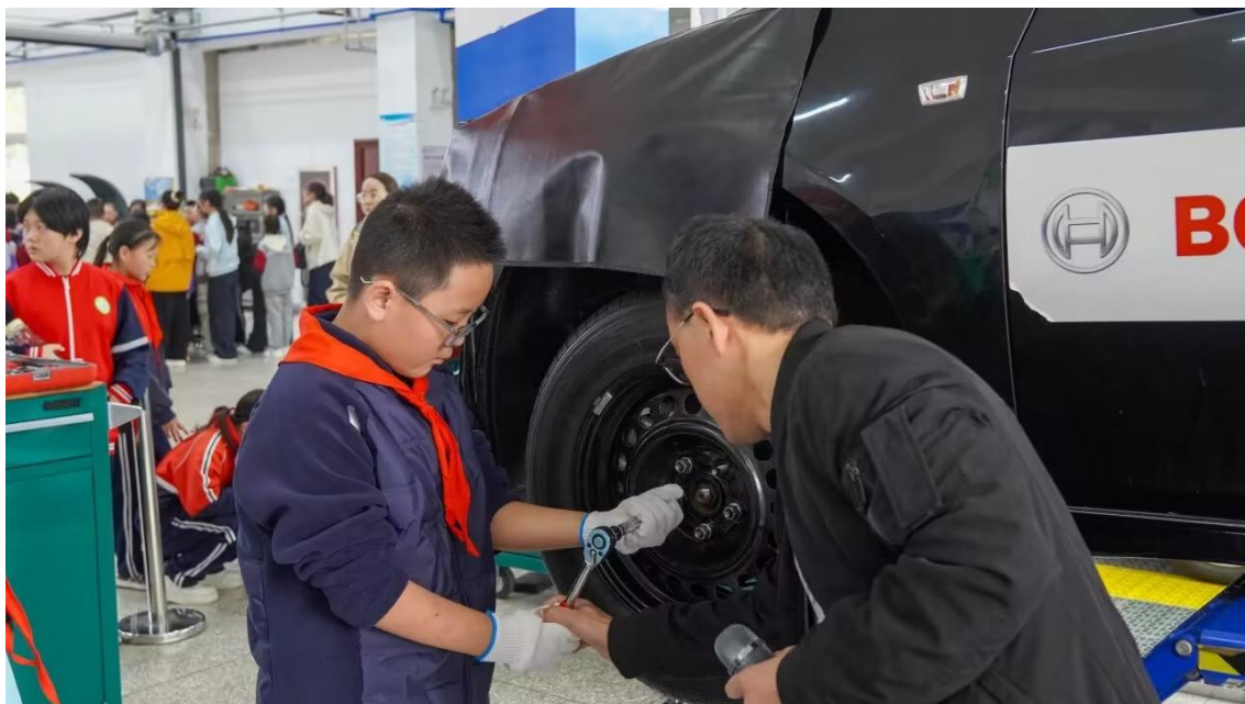
图 3-11 小学生操作体验-四轮定位

同时，汽修专业获评山西省首批中小学体验中心，面向晋城市中小學生常态化开展汽车科普、职业体验活动，年均接待师生 2297 人，形成了集教学、培训、技术服务、科普体验于一体的区域性汽车产业人才培养与技术支持基地。