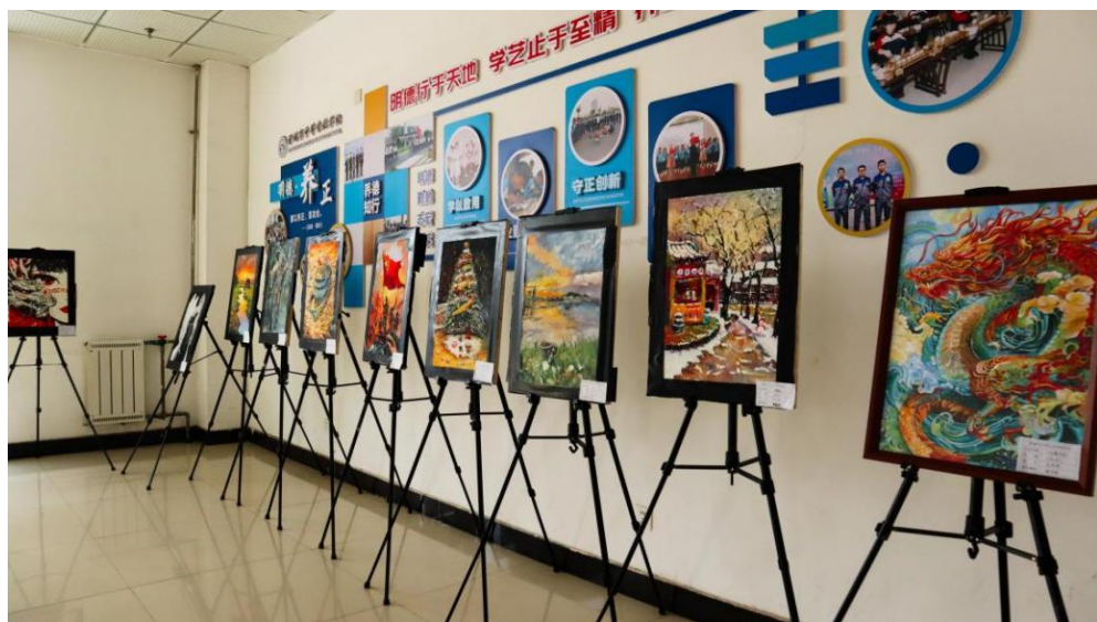
图 5-12 工艺美术作品展

为构建“五育并举”育人体系，学校依据《关于全面加强和改进新时代学校美育工作的意见》及职业教育类型特色，打造了“专业+”特色校园文化品牌。定期举办工艺美术专业写生展览、各专业教学成果展演、校园定向越野等大型活动。同时，大力支持学生社团建设，现有武术、书法、版画、棋类（棋林友海）及创客等 20 余个社团，注册会员超 500 人。社团活动与专业学习紧密结合，2025 年学生社团参与率达 85%，在省市级文体艺竞赛中获奖 50 余项。丰富多彩的文化活动不仅提升了学生的审美素养、团队协作与创新能力，更营造了积极向上、充满活力的校园文化生态，为学生全面发展提供了丰沃土壤。