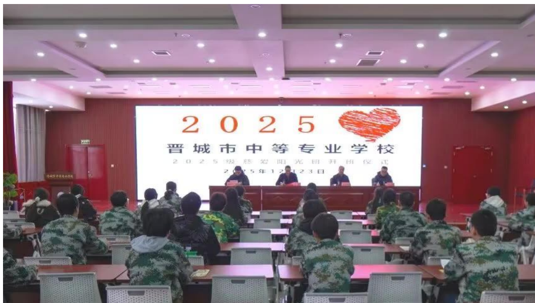
图 4-6 2025 年慈善阳光班开班仪式