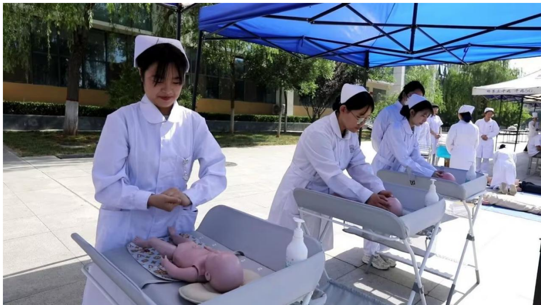
图 3-12 婴幼儿抚触展示

婴幼儿托育和幼儿保育专业录取分数线较学校其他专业平均录取线高出 15 分，生源质量位居同类专业前列。同时将 1+X 证书制度融入人才培养体系，241 名学生考取母婴护理职业技能等级证书（初级）， 近三年该证书获取率稳定在 90%以上，其中 2025 届毕业生通过率达 100% 。学校紧抓晋城市成功入选“2025 年中国康养城市排行榜百强”的契机，持续深化 “技能培训—证书考核—岗位实习—就业推荐”的闭环培养模式 ，助力毕业生快速适应行业需求，推动晋城市生活服务业向专业化、标准化升级。