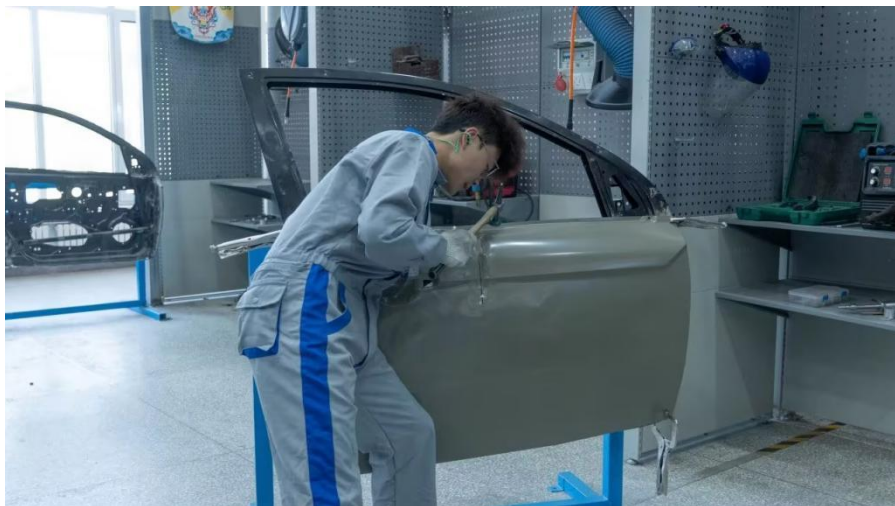
图 5-2 工匠课堂---钣金实训项目

匠课堂” ，将发动机维修、底盘保养等核心工艺融入实训，联合开发教材《汽修培训手册》，以实战案例实现“教材即工单、课堂即车间”；中餐专业与山西晋宝绿珍集团有限公司合作，选定申进磊作为中餐的行业导师，主攻热菜制作和中式面点，让学生在“做中学”中掌握精湛技艺。同时在省级技能大赛中获得一等奖的学生中选定学生助教，与专业教师和行业导师组成教学团队，定期开展实训课，让工匠精神在“教、学、做”中落地生根。