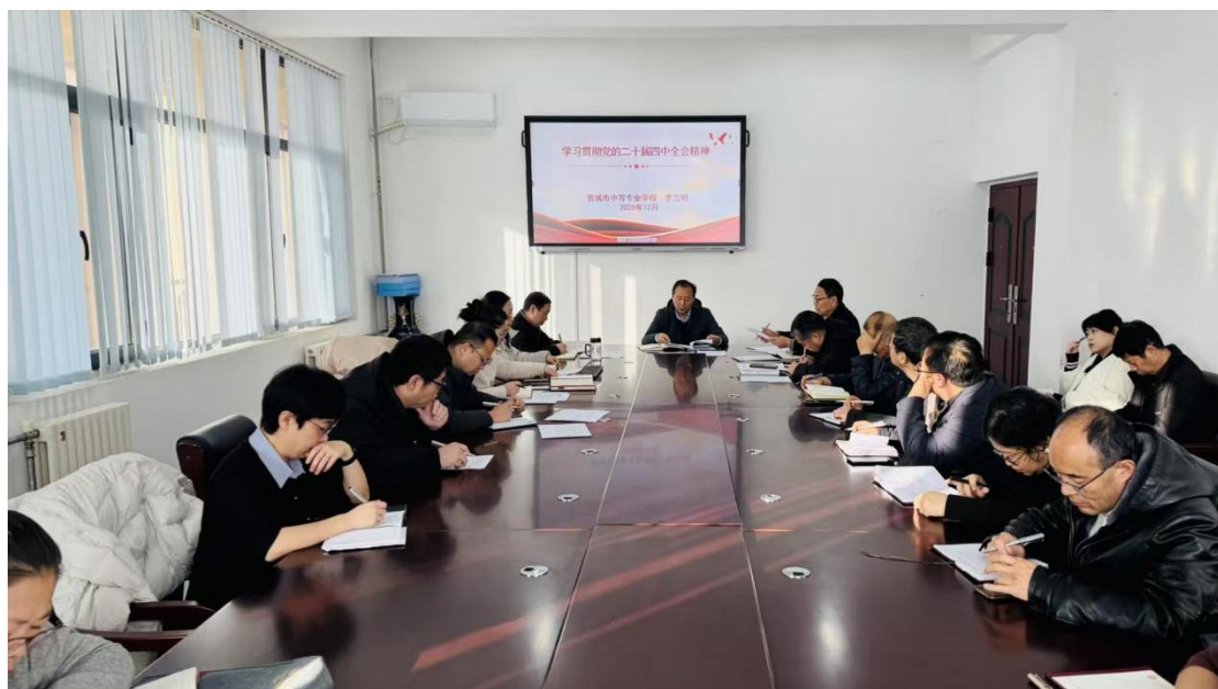
图 7-3 党的二十届四中全会宣讲会