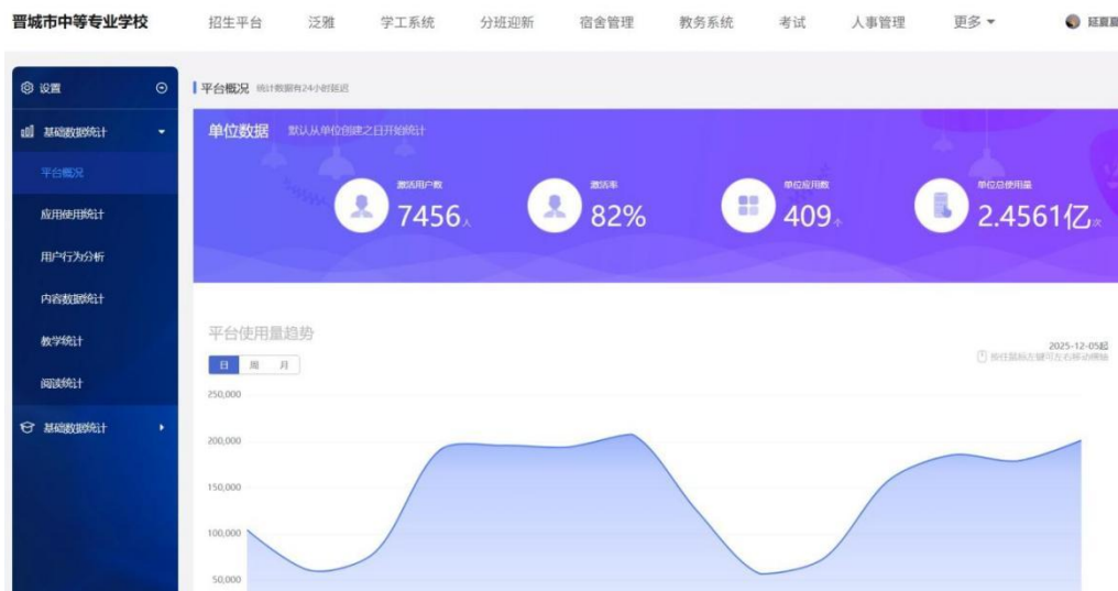
图 7-8 晋城中专信息一体化平台

信息化手段不仅是学校治理的“工具”，更是推动教育教学变革的“引擎”。通过企业微信与学习通的协同应用，学校构建了“高效协同、精准服务、智慧教学”的数字化生态，为高质量发展注入了强劲动力。