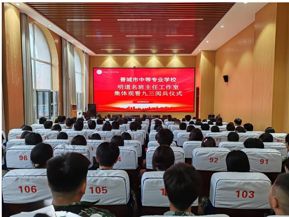
图 5-5 集体观看九三阅兵仪式

在专业课教学中挖掘红色元素。围绕“中国人民抗日战争暨世界反法西斯战争胜利80周年”主题组织系列活动，师生集中观看九三阅兵仪式，开展专题研讨活动，弘扬伟大抗战精神。行走的思政课——走进太行号兵主题展览馆，开展了2次太行精神主题团课，张敏校长为全校学生讲授微团课《晋城市本土红色英雄故事》。将晋城本地红色资源融入课程，开发并使用《红色基因代代传》校本教材，通过思政微课、团课等形式，让学生在沉浸式学习中感悟革命精神。邀请晋城市关工委、市教育局、城区关工委“五老”宣讲团成员，长江支队晋城研究会常务副会长桑玉民老师开展了“五老进校园”专题讲座，宣讲毛泽东同志的生平事迹和伟大贡献。