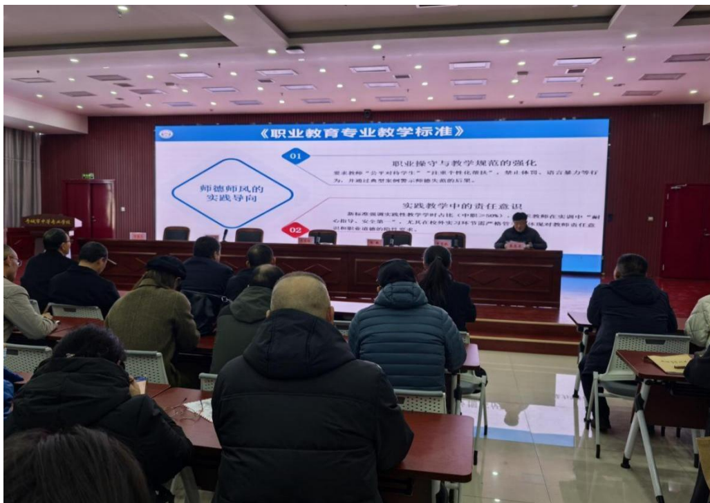
图 7-6 全校教师集体学习《职业教育专业教学标准》