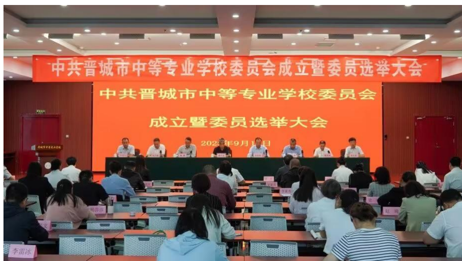
图 7-1 中共晋城市中等专业学校委员会成立暨委员选举大会