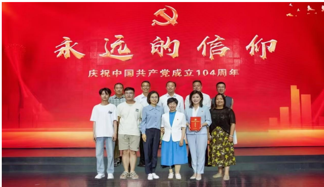
图 7-2 微党课《师者如光》获市级二等奖