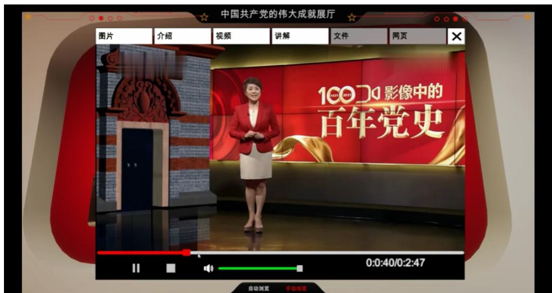
图 5-9 红色全景资源---中国共产党伟大成就虚拟展厅