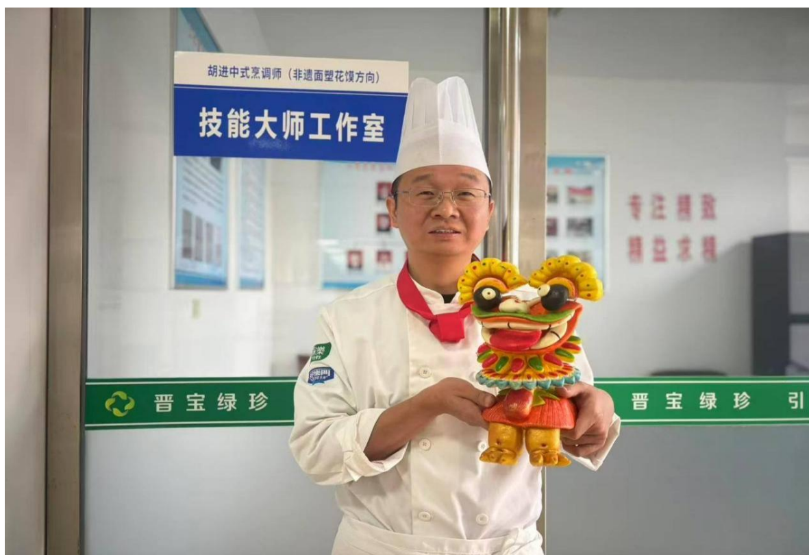
图 4-4 技能大师工作室