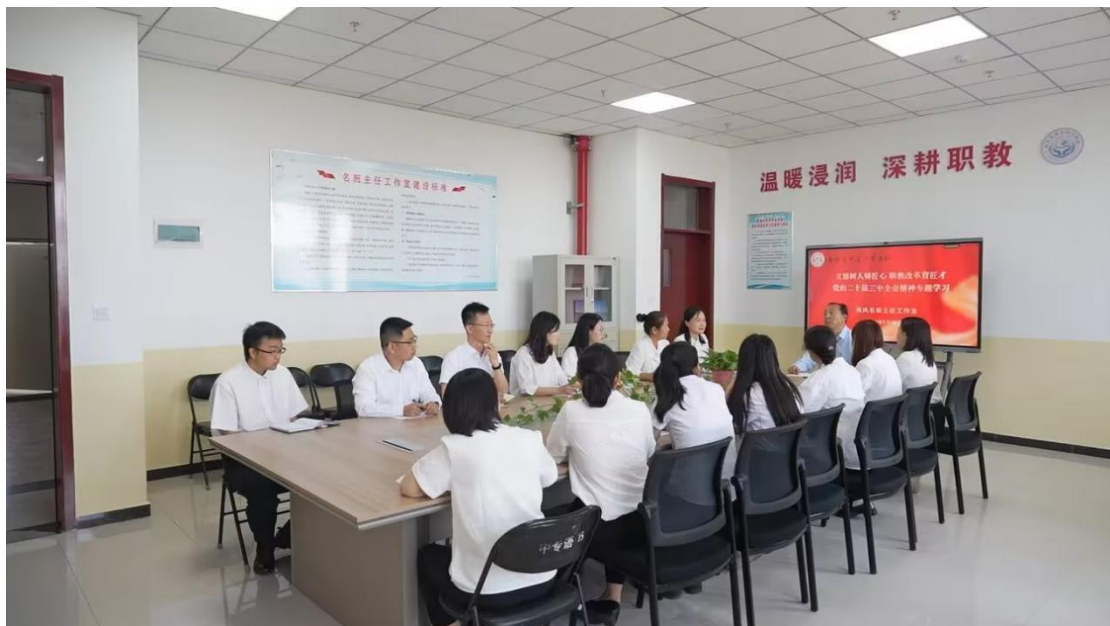
图 3-8 教师专题学习