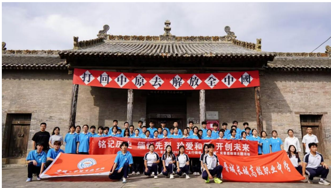
图 5-6 “太行铸魂”实景思政课活动

伸至“线上”。通过共建红色基地，不仅丰富了校园文化内涵，更让红色基因在师生心中生根发芽，成为学校培养时代新人的重要载体，为区域红色文化传承注入了新活力。