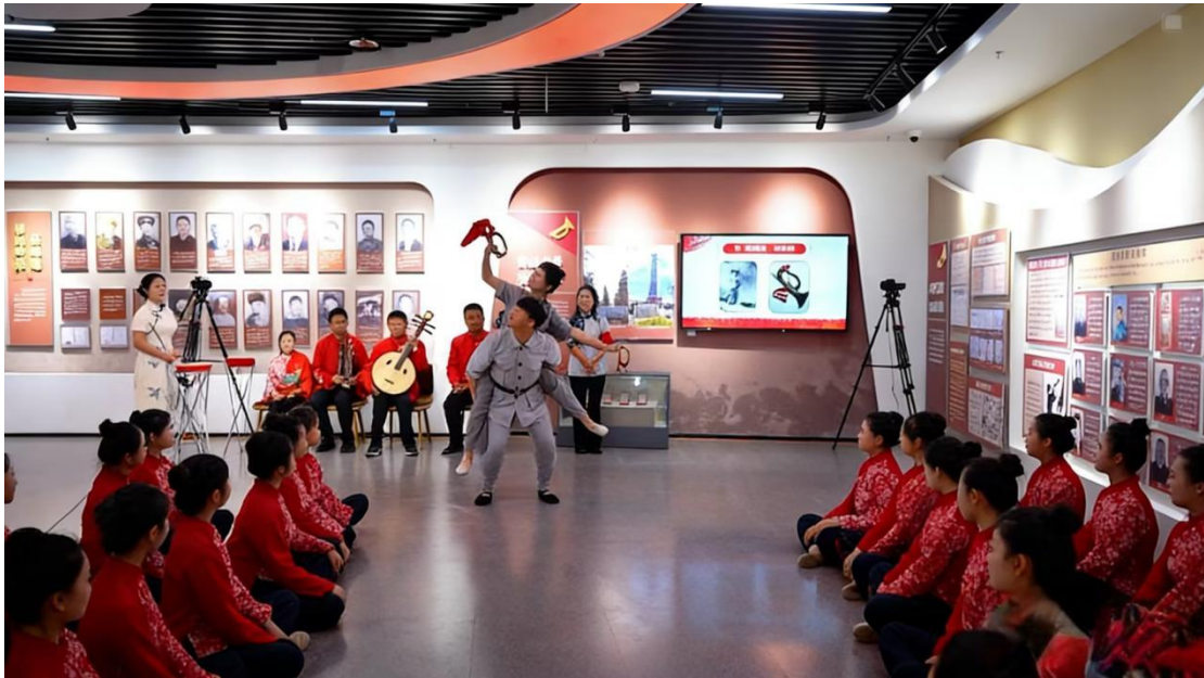
图 5-8 红色志愿宣讲团——陵川号兵

“太行精神”与中华优秀传统文化的深层关联。红色志愿团队把志愿服务与红色精神传承相结合，引导学生在实践中践行奉献精神。